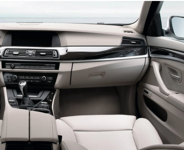
Bild 3. Modernes Interieur-Design am Beispiel einer Mittelkonsole und Instrumententafel

Beflammen, auch bei olefinbasierten Partikelschäumen anwendbar sind und zu einer ausreichenden Lackhaftung führen. Es können hier Haftkräfte erreicht werden, die höher als die Zugfestigkeit des Partikelschaums sind. Das bedeutet, dass die Lackschicht nicht ohne Zerstörung des Substrats abgelöst werden kann [5].