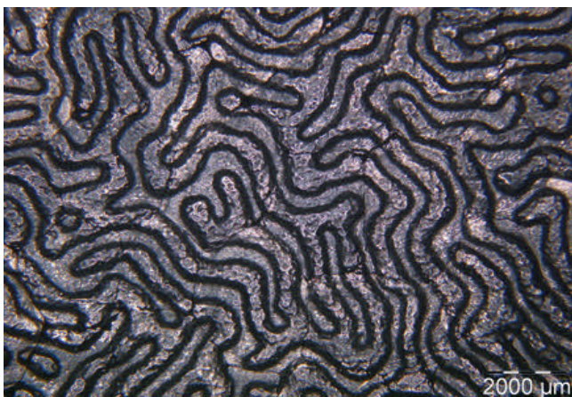
Bild 2. Mikroskopaufnahme einer Partikelschaumbooberfläche mit tiefer Narbstruktur