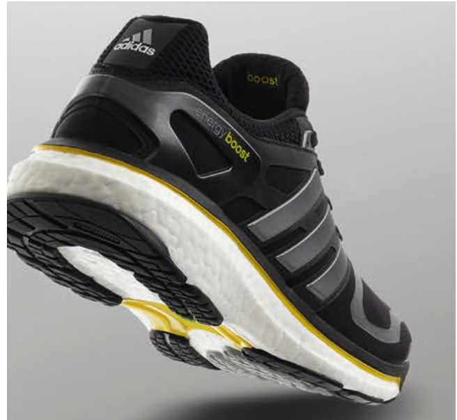
Beim Laufschuh „Energy Boost“ von adidas fungiert der Partikelschaum aus expandiertem thermoplastischen Polyurethan als Design- und Dämpfungselement

Partikelschäume. Thermoplastische Partikelschäume sind bekannt für ihre gute thermische Isolierfähigkeit und ein enormes Leichtbaupotenzial. Sie kombinieren eine geringe Dichte im Bereich von 15 bis 80 kg/m 3 mit guten mechanischen Eigenschaften und einer hohen spezifischen Energieaufnahme. Durch innovative Oberflächenmodifikationen gewinnen sie auch in den Bereichen „Design“ und „automobiles Interieur“ eine immer größere Bedeutung.